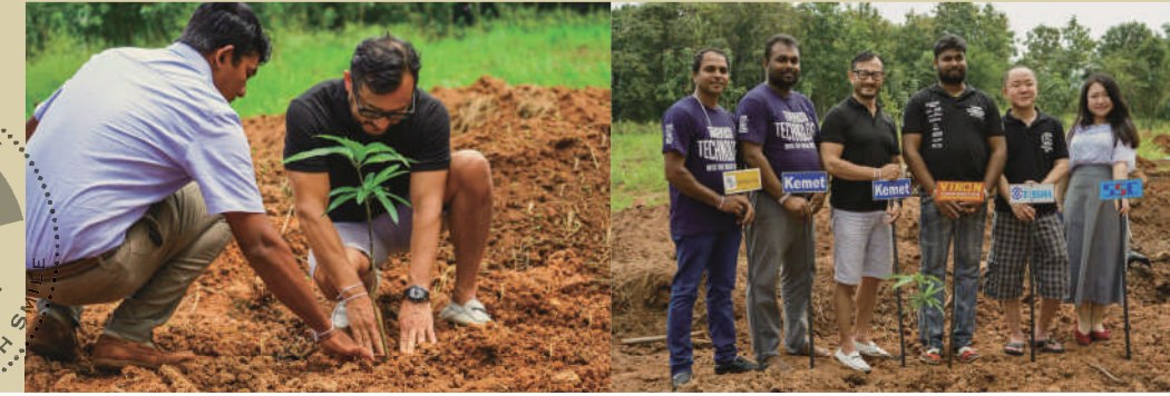
弊社 VIRON のメンバー